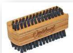
Brosse à ongles et mains

Soin tout en douceur de la peau. Irrigation sanguine de la peau améliorée.