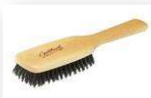
Brosse à cheveux