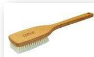
Brosse pour le bain