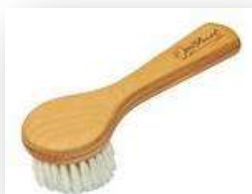
Brosse pour le visage