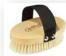
Brosse pour massages professionnels

Les brossages réguliers nettoient la peau et les ongles des mains et des pieds. Ils stimulent l'élimination par la peau des substances toxiques de l'organisme, ainsi que la circulation sanguine et le système nerveux.